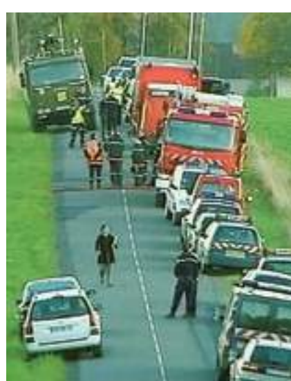
Mezzi di soccorso arrivano sul luogo dell'incidente, nelle campagne a nord di Bar-Le-Duc, a metà strada fra le città di Reims e Nancy, in Lorena